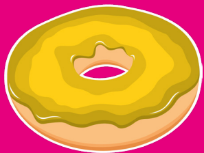
Le donut ECOLO