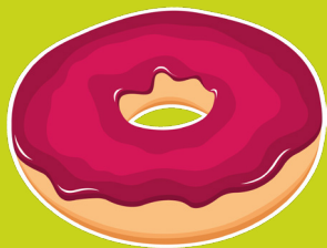
Le donut IMPECC'